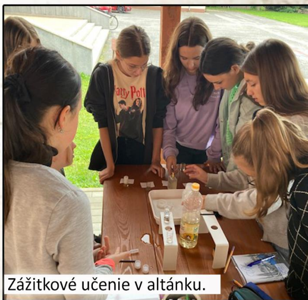
Zážitkové učenie v altánku.