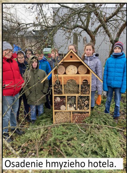
Osadenie hmyzieho hotela.