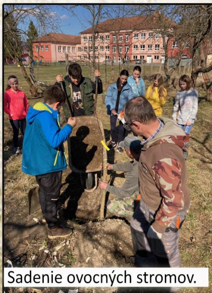
Sadenie ovocných stromov.