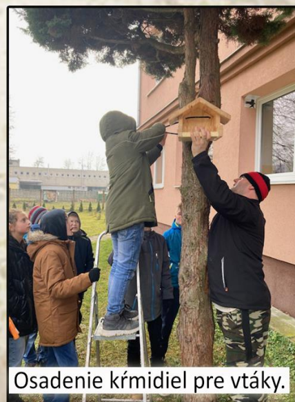
Osadenie krmidiel pre vtáky.