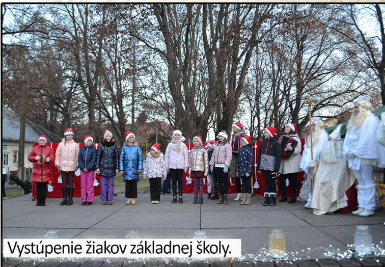
Vystúpenie žiakov základnej školy.