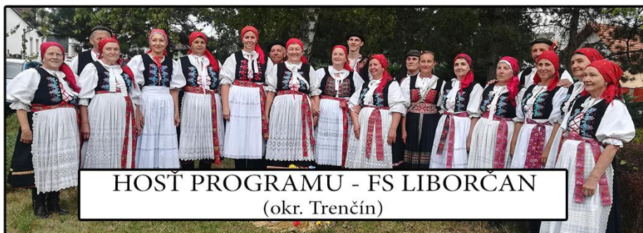
HOSTĽ PROGRAMU - FS LIBORČAN (okr. Trenčín)