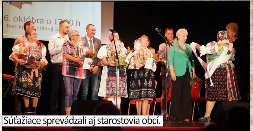
Súťažiacie sprevádzali aj starostovia obcí.

Jednotlivé súťažiacie sa predviedli v troch disciplínach. V rámci prvej s názvom „Tradíciu odovzdávam deťom“ reprezentovali pôvodný ľudový kroj, re-