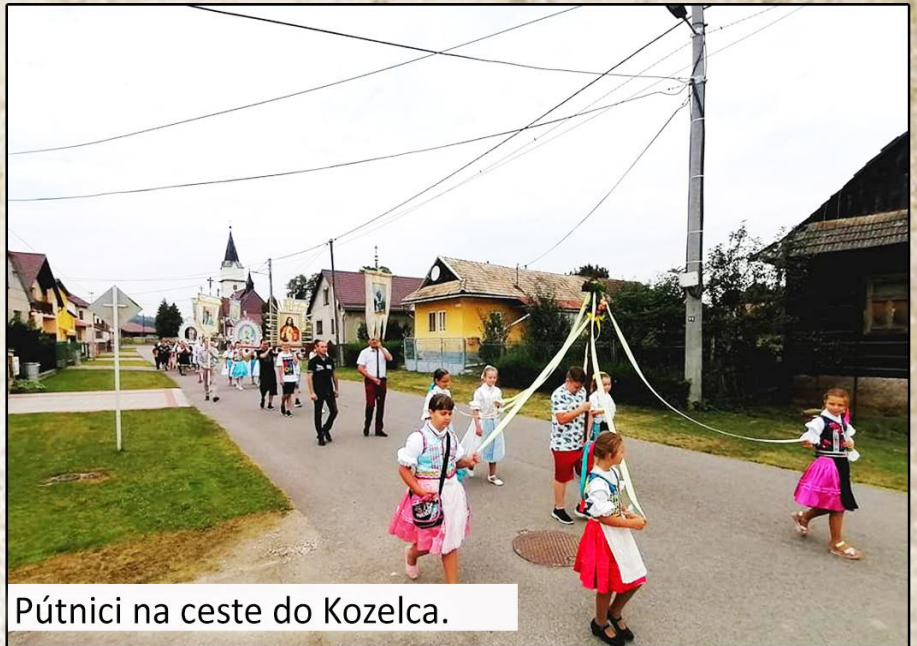
Pútnici na ceste do Kozelca.