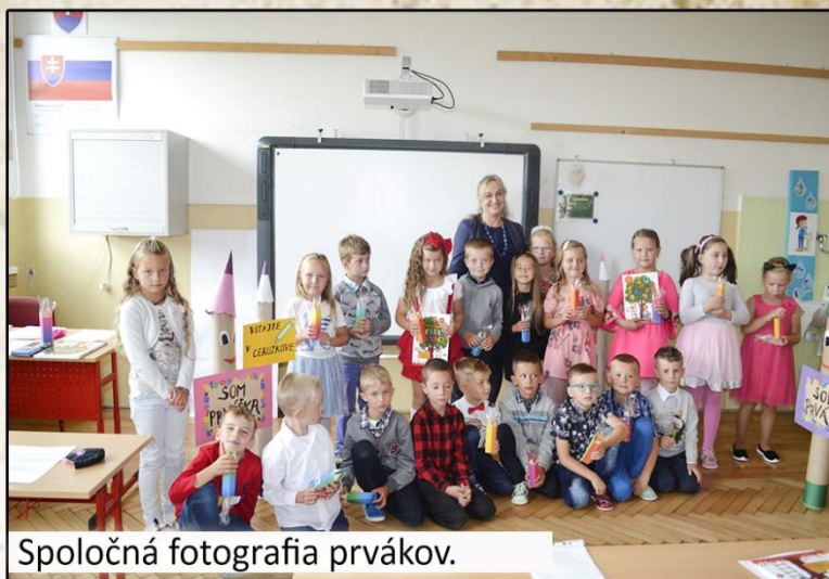
Spoločná fotografia prvákov.

Tentokrát sa žiaci nevrátili do školy po dvojmesačnej prestávke, ale niektorí si za školské lavice nesadli od marca. V septembri sa ale všetky triedy otvorili. Po sv. omši sa žiaci premiestnili do školy, kde sa nekona- lo spoločné otvorenie školského roka, ako bývalo zvykom, ale žiaci sa premiestnili rovno do tried. Do školských lavíc si prvýkrát sadlo 22 prvákov, ktorí dostali aj prvú knihu od obce. Celkovo navštevuje školu 165 žiakov. (lf)