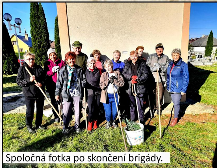
Spoločná fotka po skončení brigády.