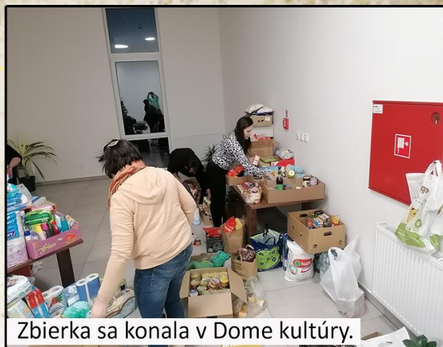
Zbierka sa konala v Dome kultúry.

Množstvo rodín prišlo zo dňa na deň o všetko a ostali im iba oči pre plač. V snahe zachrániť svoj život utekajú ukrajinci do bezpečia, aj za hranice svojho územia. Prešovský samosprávny kraj v spolupráci s mestami a obcami kraja zorganizoval charitatívnu zbierku pre priamu pomoc partnerskému regiónu v Zakarpatskej oblasti. V našej obci sa zbierka konala v stredu 16. marca. Počas celého dňa prichádzalo množstvo občanov, aby doniesli pre ľudí zo spomínaného regiónu potraviny, hygienické potreby, oblečenie, obuv, matracé a iné užitočné veci. Následne boli všetky vyzbierané veci odvezené na Úrad Prešovského samosprávneho kraja, odkiaľ boli kamiónovou dopravou odvezené na Ukrajinu. Niekoľko dní predtým sa konala zbierka zdravotníckeho materiálu, ktorú zabezpečovali členovia dobrovoľných hasičov, ktorí vyzbierali niekoľko kusov lekárničiek, vitamínov a zdravotníckych pomôcok.