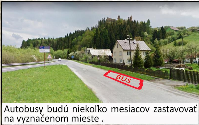
Autobusy budú niekoľko mesiacov zastavovať na vyznačenom mieste.

Obci sa vďaka grantu podarilo získať financie na rekonštrukciu autobusovej zastávky v smere na Prešov. Frekventované miesto pre občanov, ktorí cestujú autobusom, sa kompletne zmení. Projektový zámer počíta s vybudovaním nového nástupišťa, ktoré bude pozostávať z moderného autobusového prístrešku s lavičkou, osvetlením a odpadkovým košom. Potrebná bude aj úprava svahu vrátane nového odvodňovacieho kanála. Projekt počíta aj s prípravou na technologickú novinku, tzv. elektronickú tabuľu, zobrazujúcu odchody autobusov. „Pôjde iba o predprípravu podložia a elektrických rozvodov. Samotná tabuľa sa zatiaľ osadzovať nebude, nakoľko ide o