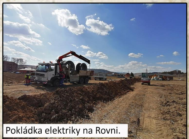
Pokládka elektriky na Rovni.

Menej nákladná akcia, ale za to očakávaná, sa začala pred niekoľkými dňami v časti Roveň, a to v rámci rozšírenia elektrickej siete. Súčasťou prác v tejto lokalite bude aj rozšírenie verejného osvetlenia, optiky a rozhlasu. Náročnejšia investícia sa dotýka celej obce a začať má čoskoro. V rámci nej sa budú meniť takmer všetky stĺpy elektrického vedenia, vrátane prípojok. O tejto akcii boli občania informovaní osobitným listom od VSD. (If)